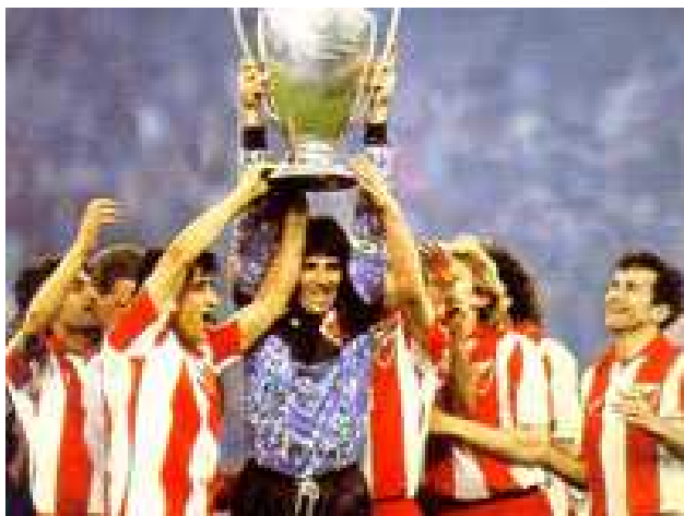
Crvena Zvezda-prvak Evrope u sezoni 1990-1991.

Kvalitet fudbala u Jugoslaviji je i bez velikih reprezentativnih rezultata bio cijenjen van granica zemlje, a u tome je veliku ulogu igrao nastup naših klubova na evropskim takmičenjima. Poseban renome krajem 70-ih i u 80-im godinama pripadao je Crvenoj Zvezdi iz Beograda. Vrhunac je dostignut u sezoni 1990/91, kada je ovaj beogradski klub osvojio kup šampiona – najznačajnije takmičenje klupskog fudbala u Evropi.