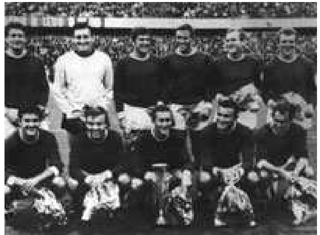
NK Dinamo iz 1967. godine