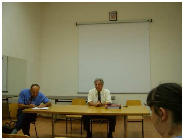
Prva redovna skupština Udruženja u Puli

Dana 26.07.2010. godine u Puli je održana 1. redovna Skupština Udruženja na kojoj smo mogli pozdraviti osnivanje prvog Kluba Jugoslavena u Splitu. Vidi: http://nasa-jugoslavija.org/Aktivnosti.htm