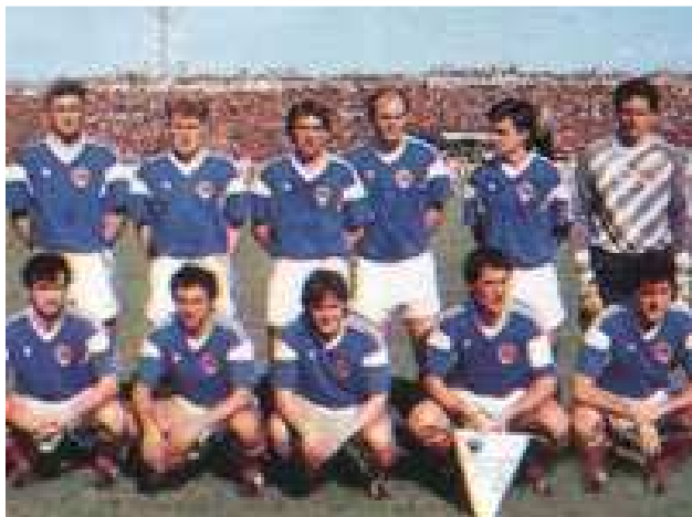
U Italiji 1990. godine

Kvalitet fudbala u Jugoslaviji je i bez velikih reprezentativnih rezultata bio cijenjen van granica zemlje, a u tome je veliku ulogu igrao nastup naših klubova na evropskim takmičenjima. Poseban renome krajem 70-ih i u 80-im godinama pripadao je Crvenoj Zvezdi iz Beograda. Vrhunac je dostignut u sezoni 1990/91, kada je ovaj beogradski klub osvojio kup šampiona – najznačajnije takmičenje klupskog fudbala u Evropi.