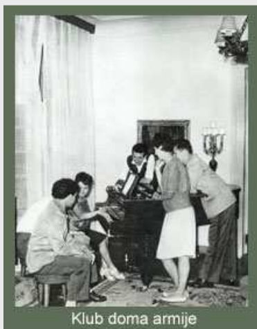
Klub doma armije

Od ne manjeg značaja bila je i idejno-politička i opšte obrazovna aktivnost starešinskog sastava. Svuda se grade domovi armije, koji izrastaju u snažna kulturna žarišta pripadnika JNA i građana.