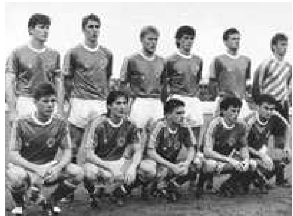
Mlada reprezentacija Jugoslavije - prvak svijeta u Čileu 1987. godine