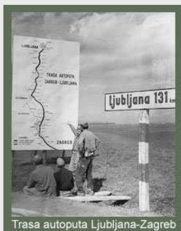
Trasa autoputa Ljubljana-Zagreb

Od prvih posleratnih dana obnove zemlje pripadnici JNA postaju aktivni sudionici izgradnje stotina privrednih objekata, a armija kao celina škola za osposobljavanje kadrova najrazličitijih profila. U izgradnji saobraćajnih, stambenih, sportskih i drugih objekata pripadnici JNA su dali milijarde radnih časova. Inženjerske jedinice su izgradile hiljade kilometara puteva, železničkih pruga, mostova i tunela.