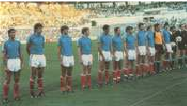
Jugoslavenska ekipa u Španiji 1982. godine