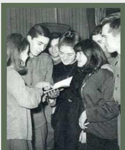
U posjeti kasarni JNA

Društveno i političko angažovanje pripadnika JNA je višestruko. Njeni pripadnici imaju sva politička prava kao i drugi građani, a gotovo celokupni starešinski sastav je angažovan u organizacijama van armije: SK, SSRNJ, SUBNOR, organima narodne vlasti, SRVS, stručnim i profesionalnim asocijacijama i dr. U rukovodstvima DPO i DPZ od MZ do federacije bilo je prosečno 20 odsto vojnih lica.