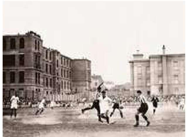
Fudbal u Jugoslaviji 1929. godine

Kraljevine SHS. U tom momentu su na teritoriji tadašnje države egzistirala već 63 kluba. Broj je rastao relativno brzo tako da već 1922. godine savez broji 160 klubova, što je radi lakšeg organizovanja kao logičnu posljedicu imalo formiranje regionalnih saveza. Ovakav intenzitet razvoja fudbala doveo je ubrzo i do prvih međunarodnih utakmica tadašnjeg reprezentativnog sastava prilikom učešća na Olimpijskim igrama u Antwerpenu 1920. godine. Prvi susret reprezentacija Kraljevine SHS je imala protiv Čehoslovačke, a završen je pravim debaklom – Česi su pobijedili sa 7:0! To, naravno, nije pokolebalo zaljubljenike fudbalske igre našeg podneblja, a da je sve krenulo ka boljem pokazale su naredne godine i generacije novih igrača.