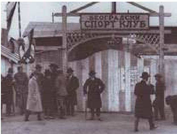
Beogradski sportski klub

Dolazak fudbala na naše prostore veže se za vrijeme oko 1900. godine. Studenti iz najvećih gradova, Beograda i Zagreba, koji su kroz školovanje u nekim drugim evropskim prijestonicama tog vremena (Beč, Prag, Budimpešta...) dolazili u dodir sa novom igrom, prenijeli su je i u sredine iz kojih potiču. Zanimanje za ovaj „novi“ sport dovelo je do osnivanja prvih, danas manje poznatih fudbalskih klubova 1903. godine, a 1911. bilježimo osnivanje poznatih – Hajduk Split, Beogradski sportski klub (BSK, kasnije OFK Beograd), te Građanski Zagreb.