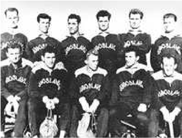
Jugoslavenska ekipa iz 1952. godine

U finalu je Jugoslavija izgubila od Mađarske rezultatom 2:0. Svakako treba napomenuti da je u tom susretu Vladimir Beara odbranio jedanaesterac jednom od najboljih igrača svijeta – Ferenzu Puškašu.