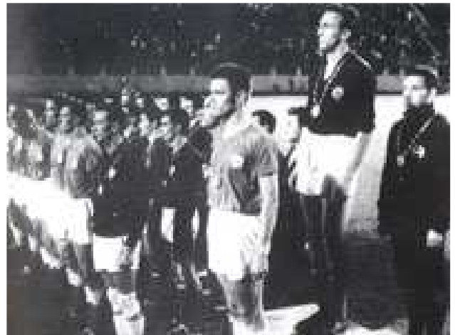
Zlatna medalja u Rimu 1960. godine

Prva veća smotra fudbala na međunarodnom nivou došla je već 1948. godine na Olimpijskim igrama u Londonu. Tu bilježimo i prvi veliki uspjeh našeg fudbala – reprezentacija Jugoslavije je osvojila drugo mjesto i srebrnu medalju. U finalu je bolja bila Švedska, pobijedivši sa 3:1. Osvajanje olimpijske medalje dalo je još više podstreka razvoju fudbala u Jugoslaviji, a uspjesi nisu izostali. Tako je i na naredna dva takmičenja (1952. u Helsinkiju i 1956. u Melbourne-u) osvojena srebrna, da bi konačno 1960.