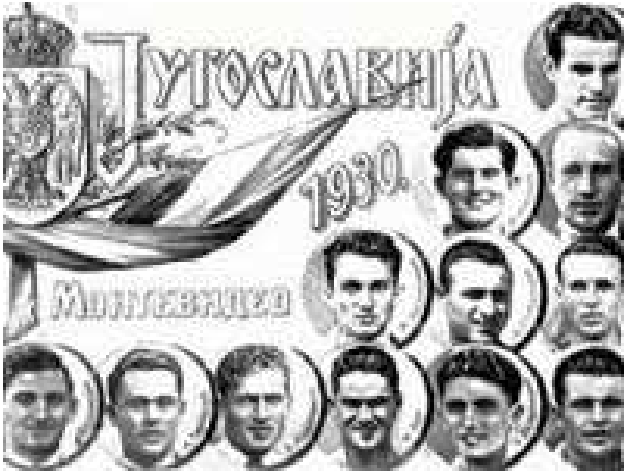
Jugoslavenska ekipa 1930. godine u Urugvaju

Kraljevina Jugoslavija je učestvovala sa još 12 drugih država na prvom svjetskom fudbalskom prvenstvu, koje je održano u Urugvaju 1930. godine.