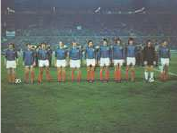
Jugoslavenska ekipa u Njemačkoj 1974. godine

Godine 1976. Jugoslavija je bila domaćin EP. Sistem takmičenja je predviđao da se kvalifikacijama odluči koje tri reprezentacije, pored naše, mogu učestvovati u završnici – polufinalnim i finalnim utakmicama.