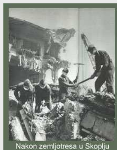
Nakon zemljotresa u Skoplju

Gotovo da nije bilo elementarne nepogode i katastrofe (zemljotresi, poplave, požari i sl.) da se pripadnici JNA nisu među prvima uključivali u akciju spasavanja života i imovine građana. Požrtvovanje, samopregor i moral koji su u takvim trenucima ispoljavani još više su podizali ugled JNA i predstavljali su samo jedan od mnogih dokaza spone armije i društva.