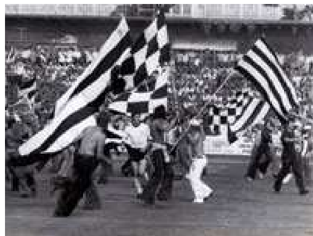
Nekada je to bila normalna pojava – navijači slave pobjedu zajedno sa igračima

Tu je, dakako, „večiti derbi“ između Zvezde i Partizana, zatim neizbježni duel Sarajeva i Željezničara (popularnog „Želje“), gradski derbi Dinama i Zagreba, a u vrijeme dok je NK Split bio član prve savezne lige Hajduk je imao svog „ljutog“ gradskog rivala.